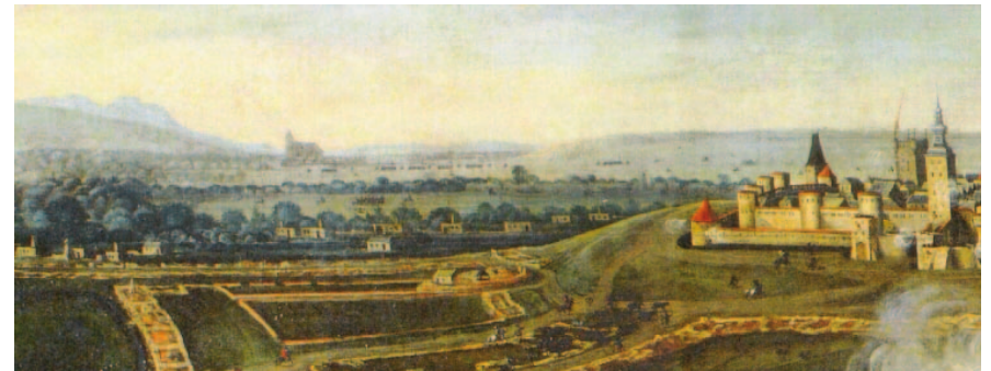
Modřický kostel na výřezu z veduty Brna 1645 - 46

Po hradu před 700 lety, předpokládáném na mírném návrší jihozápadně vedle kostela, archeologové zatím nenašli žádné významné stopy a dobové dokumenty budou nejspíš někde v zaprášeném archívu ... nebo je to jinak? Lidé jsou zvědaví, většinou i pracovití a tak byl systematickým úsilím archivářů už v 19. století sestaven a vydán Codex diplomaticus et epistolaris Moraviae . Tedy „Soubor listin a listů moravských“ od nejstarších dob po rok 1411, označovaný jako „Moravský diplomatár“, nebo zkratkou CDM . Je trochu smutné, že zatímco tato „bible“ pro historii Moravy vznikla více než 50 let před podobným dílem o Čechách, tak v současnosti pražské nakladatelství Academia ani za 10 let není schopno dokončit vydání Uměleckých památek Moravy a Slezska - jediné souhrnné odborné práce o téměř polovině našeho historického státu. Zato maximální uznání si zaslouží Centrum medievistických studií Akademie věd a Univerzity Karlovy, na jehož internetovém portále je volně zpřístupněno téměř 300 svazků edice k českým středověkým dějinám, kde samozřejmě těch asi 7 tisíc stran CDM nemůže chybět. A tak se díky technice 21. století můžeme na internetové adrese v tiráži vydat na virtuální procházku za svědectvím o dobách dávno minulých.