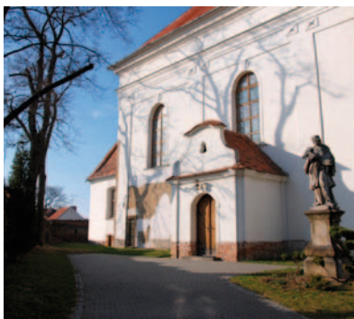
současný pohled na barokně přestavěný kostel sv. Gotharda