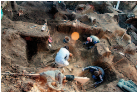
Preparace hrobů z 12. století na ul. Havlíčkova

Za nějakou desítku let - počátkem 13. století je situace výrazně jiná. Skončila doba údělných knížat a vzniklo markrabství moravské (1182), olomoučtí biskupové se stali hlavní oporou české královské moci na Moravě a byla zahájena silná vlna kolonizace - především z Podunají. Je vysoce pravděpodobné, že současně s příchodem nových německých osadníků vznikl v Modřicích také původní románský kostel (kaplan Willehemus - 1222) a opevněný dvorec, který byl později označován jako „castrum“ hrad. Ten tvořil nejen středisko panství, ale především ve 13. a 14. století sloužil jako základna pro pobyty olomouckých biskupů na jižní Moravě v blízkosti markraběcího sídla . Počátkem 15. stol. se však už většina jednání, týkajících se modřického lenního obvodu, odehrává v Brně a od roku 1590 do ukončení patrimoniální správy (1848) jsou Modřice již součástí biskupského panství Chřilice.