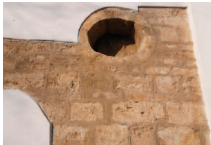
Jednoduché románské kruhové okno

Po hradu před 700 lety, předpokládáném na mírném návrší jihozápadně vedle kostela, archeologové zatím nenašli žádné významné stopy a dobové dokumenty budou nejspíš někde v zaprášeném archívu ... nebo je to jinak? Lidé jsou zvědaví, většinou i pracovití a tak byl systematickým úsilím archivářů už v 19. století sestaven a vydán Codex diplomaticus et epistolaris Moraviae . Tedy „Soubor listin a listů moravských“ od nejstarších dob po rok 1411, označovaný jako „Moravský diplomatár“, nebo zkratkou CDM . Je trochu smutné, že zatímco tato „bible“ pro historii Moravy vznikla více než 50 let před podobným dílem o Čechách, tak v současnosti pražské nakladatelství Academia ani za 10 let není schopno dokončit vydání Uměleckých památek Moravy a Slezska - jediné souhrnné odborné práce o téměř polovině našeho historického státu. Zato maximální uznání si zaslouží Centrum medievistických studií Akademie věd a Univerzity Karlovy, na jehož internetovém portále je volně zpřístupněno téměř 300 svazků edice k českým středověkým dějinám, kde samozřejmě těch asi 7 tisíc stran CDM nemůže chybět. A tak se díky technice 21. století můžeme na internetové adrese v tiráži vydat na virtuální procházku za svědectvím o dobách dávno minulých.