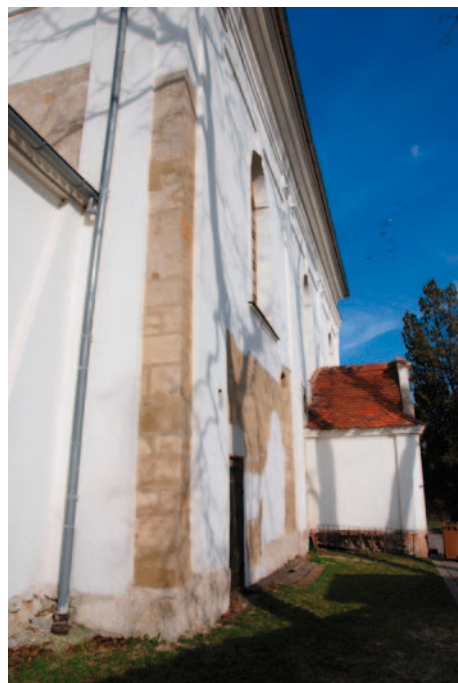
zbytky mohutné věže splývající se záp. průčelím románského kostela

Autorské a redakční zpracování Čevela - mim.cemotel.cz/historie , foto Hájek spolupráce a foto Rudolf Procházka překlad z citací CDM a foto Petr Fiala Vydává město Modřice, duben 2011 www.mesto-modrice.cz Grafická úprava a tisk: Poring a.s.