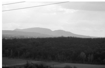
Silueta pálavských kopců

Na konci sadů máme před sebou plot a za ním vidíme budovy drůbežárny a v dálce Kohoutovice (415m, asi 8 km). Před plotem zahne doprava a v koutě (5) se cesta otáčí zpět k Modřicím. V zimě nebo na jaře se dá projít řídkým akátovým lesíkem na jeho okraj k mysliveckému posedu pod elektrickým vedením, odkud jsou zajímavé pohledy na Moravany, Lískovec i Brno. Do lesíka se kdysi děti z modřické školy chodily dívat na balvany bílých křemenů a na severním svahu k Brnu se v několika rýhách těžil hadec, používaný i jako kámen v ulicích. V létě a na podzim, jsou však dnes tato místa díky bujně vegetaci prakticky nepřístupná..