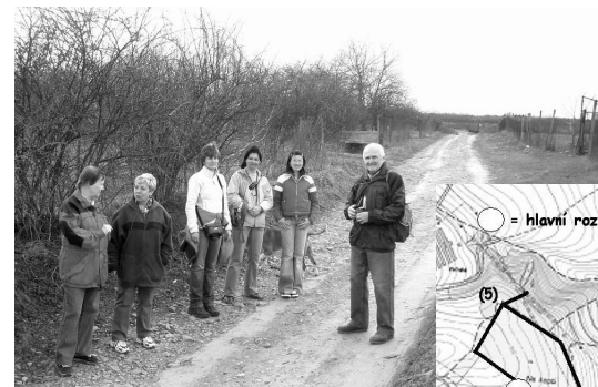
Na cestě do prvního kopce

Po cestě na tehdy ještě nezarostlé jeho východní hraně jsme s manželkou před čtyřiceti lety jezdili na běžkách a chodili na procházku s dětmi. Proto mi velice vadilo, že potom bývalé JZD celý kopec i s veřejnými cestami oplotilo a znepřístupnilo. Dnes je opět možné se do tohoto prostoru vydat, ale vzhledem k tomu, že jde o areál soukromých meruňkových a broskvových sadů, který je současně uznanou bažantnicí, tak je nutné chodit po cestách a tento stav příslušně respektovat.