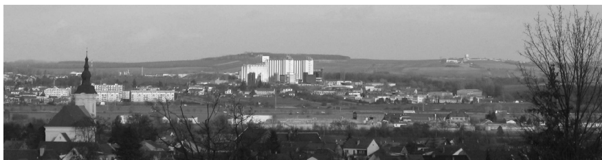
Chrlické sídlo a Pracký kopec

Východiskem (V) naší vycházky je křižovatka před restaurací „U Trávnička“ na ulici Brněnská. Nejprve se vydáme západním směrem podchodem pod rychlostní komunikaci s tramvají a mírným obloukem vlevo nahoru, až se před námi objeví skladový areál velkoobchodu „Ptáček“. Přejdeme na vedlejší komunikaci před ním a pokračujeme vlevo po asfaltce. Ta po mírném stoupání v pravém oblouku za chvíli odbočí jižním směrem do dlouhé roviny mezi zahradami (1), avšak my pokračujeme západním směrem strmou kamenitou polní cestou nahoru do kopce. Po levé straně jsou zahrady se stromy, vpravo velký nově oplocený poměrně mladý broskvový sad. Pokud se v průběhu stoupání ohlídneme, východním směrem uvidíme silo v Chrlicích (4,5 km) a přímo za ním pak 12 km vzdálený Pracký kopec (324m) s Mohylou míru a kupolí vojenského radaru.