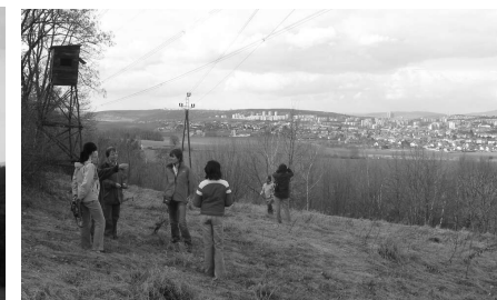
Nový Lískovec a Bohunice ze severního svahu

Po cestě podél keři zarostlé hormí hrany svahu pokračujeme směrem k Modřicím. Kousek za mysliveckým posedem, vyrobeným z části bývalé hasičské věže, se vlevo naskytne volnější prostor pro výhled. To je asi místo, kde je v konceptu Územního plánu navržena rozhledna. Ani by to nemusela být věž, ale stačila by plošina na podpěrách, vysunutá pár metrů ze svahu - a zajistila by téměř 180-stupňový rozhled, jsme totiž pořád na převýšení kolem 100 m nad řečištěm Svratky a tedy dnem brněnské kotliny.