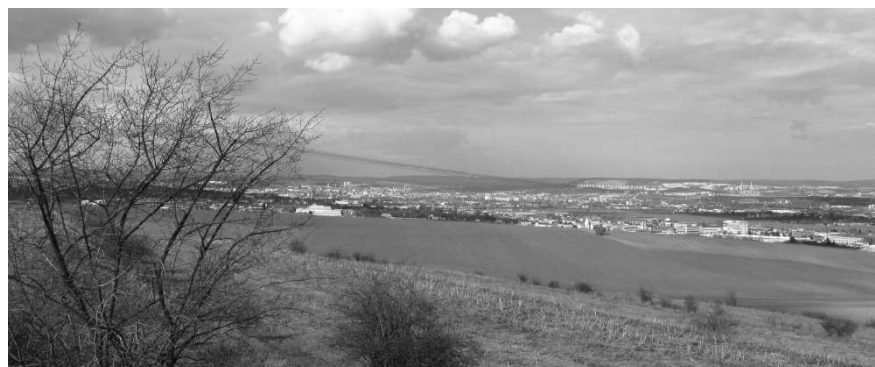
Tady by mohla být vyhlídková plošina

Po cestě podél keři zarostlé hormí hrany svahu pokračujeme směrem k Modřicím. Kousek za mysliveckým posedem, vyrobeným z části bývalé hasičské věže, se vlevo naskytne volnější prostor pro výhled. To je asi místo, kde je v konceptu Územního plánu navržena rozhledna. Ani by to nemusela být věž, ale stačila by plošina na podpěrách, vysunutá pár metrů ze svahu - a zajistila by téměř 180-stupňový rozhled, jsme totiž pořád na převýšení kolem 100 m nad řečištěm Svratky a tedy dnem brněnské kotliny.