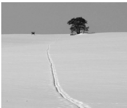
po trase staré cesty k (1)