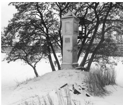
boží muka z r. 1604 (1)