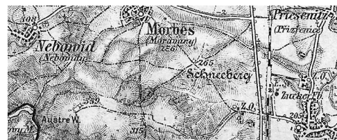
stará mapa okolí Brna

Na mapě z konce 19. století se můžeme přesvědčit, že vlastně jdeme po trase staré polní cety z Modřic do Moravan. Mapa zde taky uvádí německý název „Schneeberg“ - Sněžný Vrch, ale ten se vztahuje k výškové kótě 265 m n.m., která je od (1) ještě asi 400 m dál. V ochranné betonové skruži je tam zasazena nivelační značka (2) a hned vedle - z dálky to vypadá jako menší postava - stojí lišejníkem porostlý starobylý kámen. Na webu [kříže] v databázi smírčích křížů je bez dalších údajů pouze zmínka, že jde o řecký kříž. Publikace [Moravany] pak na str. 22 uvádí, že snad ve středověku plnil funkci mezníku mezi moravanským a modřickým katastrem - oba byly v majetku církevních vrchností.