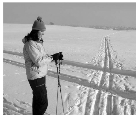
stopa z místa (3) směrem na Modřice

Již od (1) jsme na hřebenu, kde se nám jízdu směrem ke (2) postupně otevírá perfektní, prakticky kruhový rozhled. Z opakovaných návštěv v zimním období na běžkách mohu z vlastní zkušenosti potvrdit, že Sněžný Vrch je pro tento kopec skutečně výstižné pojmenování. Pokud sníh je, tak ho zde vždycky bývá dost - a taky tady na něm někdy i pěkně ostře fouká.