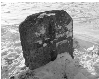
na Sněžném Vrchu (2) - leden 2007

Na mapě z konce 19. století se můžeme přesvědčit, že vlastně jdeme po trase staré polní cety z Modřic do Moravan. Mapa zde taky uvádí německý název „Schneeberg“ - Sněžný Vrch, ale ten se vztahuje k výškové kótě 265 m n.m., která je od (1) ještě asi 400 m dál. V ochranné betonové skruži je tam zasazena nivelační značka (2) a hned vedle - z dálky to vypadá jako menší postava - stojí lišejníkem porostlý starobylý kámen. Na webu [kříže] v databázi smírčích křížů je bez dalších údajů pouze zmínka, že jde o řecký kříž. Publikace [Moravany] pak na str. 22 uvádí, že snad ve středověku plnil funkci mezníku mezi moravanským a modřickým katastrem - oba byly v majetku církevních vrchností.