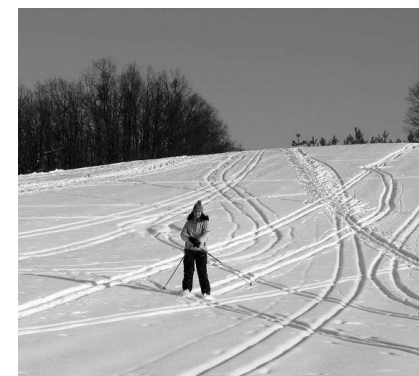
sjezd v areálu pod sedlem (5)

Od kříže na Sněžném Vrchu (2) se vydáme asi 300 m směrem západním do velice nízké prolákliny, kde zpravidla narazíme na projetou stopu (3). Po ní se můžeme příjemným mírným sjezdem vrátit na začátek trasy (Z). Časově i fyzicky náročnější variantou pak je pokračování do kopců západním směrem. Prvním cílem je menší technická stavba (4) u místní silnice z Moravan k rozsáhlému zemědělskému areálu v lese za 400 kV elektrickým vedením. Dnes je v něm snad chov drůbeže, ale my starší zde pamatujeme pověstný a obávaný „prasečák“ VEPA, často nepříjemně zapáchající do okolí několika kilometrů.