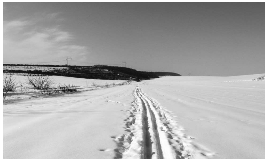
začátek vycházky, pohled od (Z)

Opakovaná sněhová nadílka v průběhu ledna 2010 po několika letech opět připravila dobré podmínky pro vyznavače bílé stopy. Pro první číslo naší inspirační prospektové edice jsme proto z několika možností vybrali trasu na Sněžný Vrch a dále po kopcích západním směrem. Že vám to místní jméno nic neříká? - tak se třeba i něco zajímavého dozvíte.