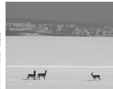
na hřebenu Sněžného Vrchu

Již od (1) jsme na hřebenu, kde se nám jízdu směrem ke (2) postupně otevírá perfektní, prakticky kruhový rozhled. Z opakovaných návštěv v zimním období na běžkách mohu z vlastní zkušenosti potvrdit, že Sněžný Vrch je pro tento kopec skutečně výstižné pojmenování. Pokud sníh je, tak ho zde vždycky bývá dost - a taky tady na něm někdy i pěkně ostře fouká.