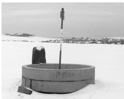
na Sněžném Vrchu (2) - leden 2010